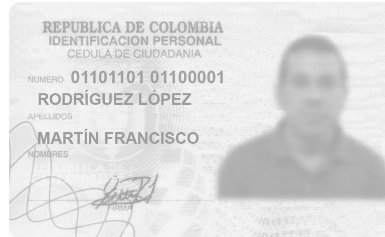
ANTERIOR VERSIÓN - FORMATO FÍSICO