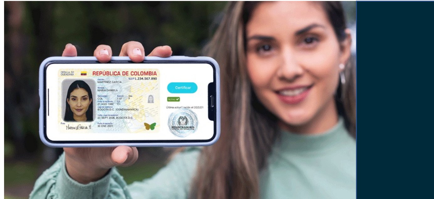
Vista desde un dispositivo móvil.

La persona que solicita la cédula digital no debe entregar la cédula amarilla o tradicional .