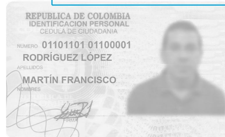
ANTERIOR VERSIÓN - FORMATO FÍSICO